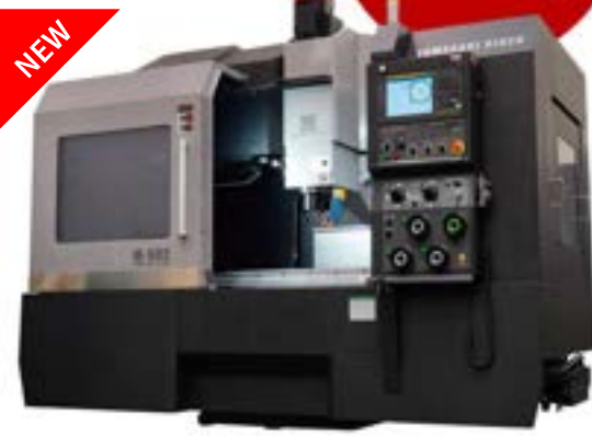
フルカバーマシニングセンタ M-502