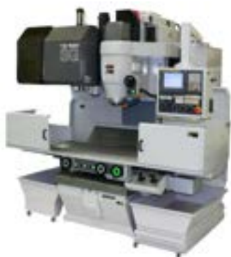
立形マシニングセンタ YZ-500SGATC