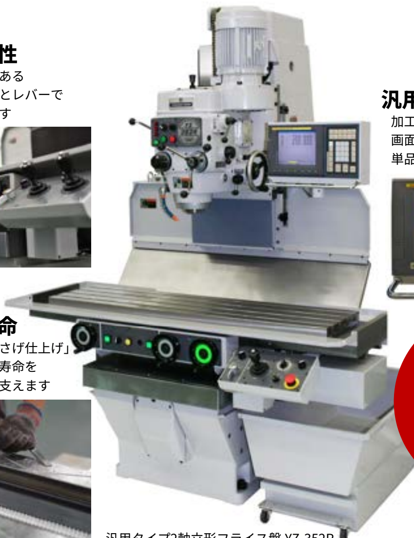
汎用タイプ2軸立形フライス盤 YZ-352R